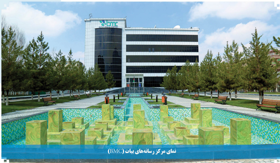
نمای مرکز رسانه های بیات (BMC)