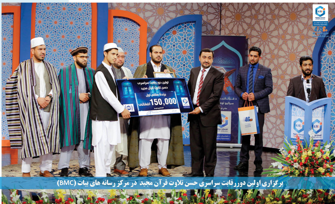
برگزاری اولین دور رقابت سراسری حسن تلاوت قرآن مجید در مرکز رسانه های بیات (BMC)

HD VOICE SWIFI @myawcc www.afghan-wireless.com 152